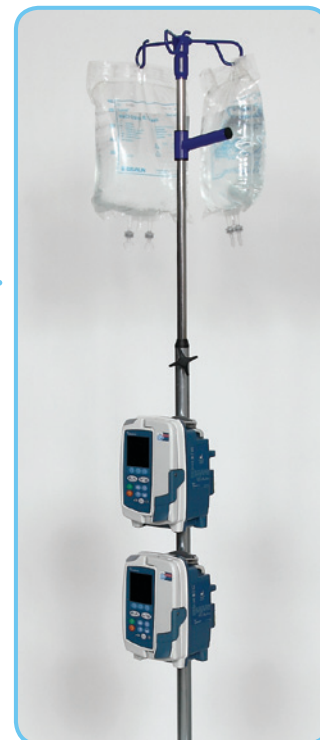
Elvira med utrustning.